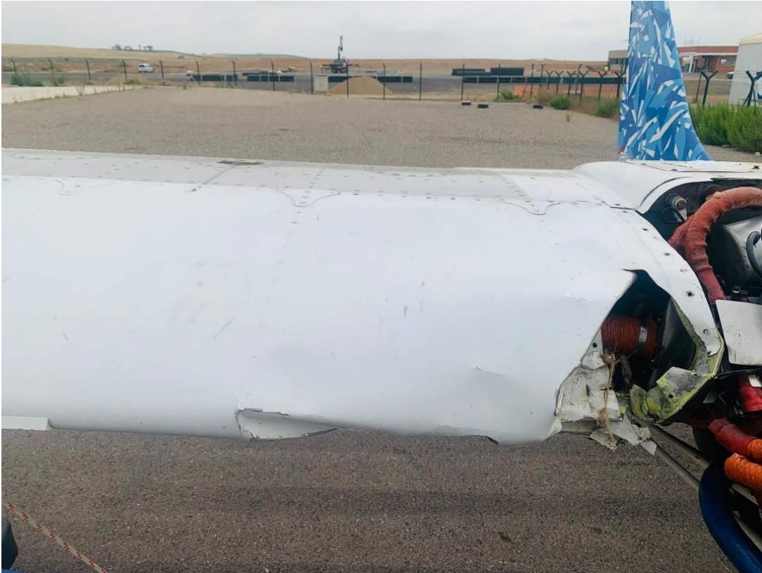
Figura 1 – daños en borde de ataque