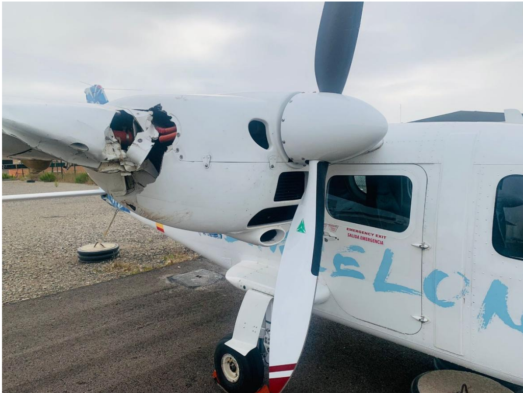
Figura 2 – daños en góndola de motor